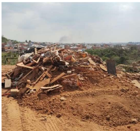
Imagem da infração .: